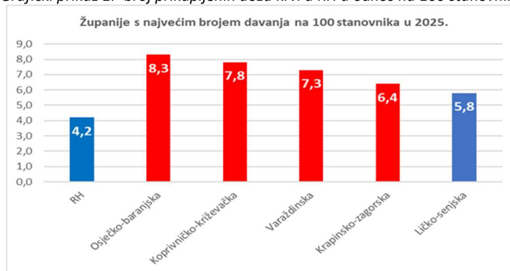
Grafički prikaz 1.- broj prikupljenih doza krvi u RH u odnos na 100 stanovnika

Prikupljanje dostatnih količina krvi za potrebe zdravstvenih ustanova na području djelovanja HCK DCK Osječko-baranjske županije ostvaruje se kroz promociju davalaštva krvi i organizaciju darivanja krvi pri DHCK zahvaljujući davateljima koji se kroz aktive organizirano uključuju u akcije dobrovoljnog davanja krvi kao i individualnim darivateljima. U Republici Hrvatskoj funkcionira "Krvotok solidarnosti", što znači da se za ona područja na kojima se ne zadovoljavaju potrebe zdravstvenih ustanova za krvi kao lijek, akcije dobrovoljnog davanja krvi organiziraju solidarno na drugim područja Hrvatske. Stoga je u 2025. godini krv s područja Osječko-baranjske županije, osim za potrebe KBC-a Osijek, prikupljena i korištena u ostalim zdravstvenim ustanovama s područja koje svojim djelovanjem pokriva Klinički zavod za transfuzijsku medicinu KBC-a Osijek, ali i na ostalim područjima Republike Hrvatske.